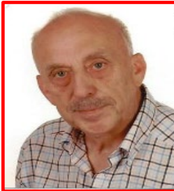
Lothar Kuhn Elsterweg 3 66333 Völklingen