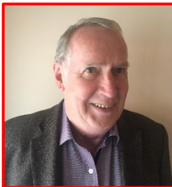
Reinhold Ollinger Im Brühl 13 66706 Perl-Büschdorf

Tel.: 06868 303 Mobil: 0171 7833783 Fax: 06868 180214